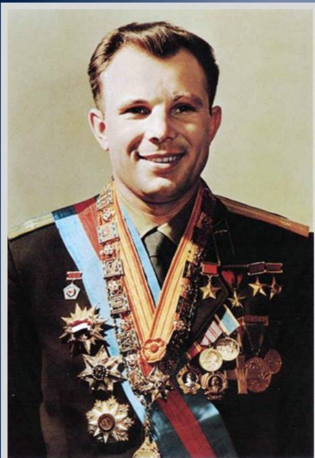
Юрий Алексеевич Гагарин